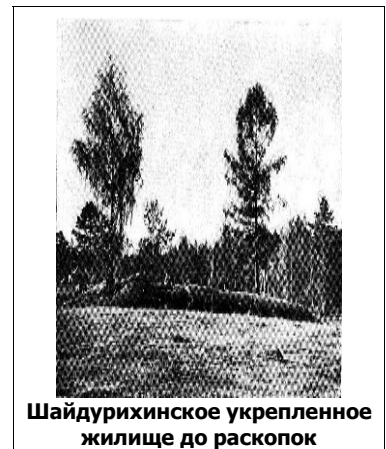
Шайдурихинское укрепленное жилище до раскопок

При раскопках, проведенных уральской экспедицией в 1959 году, такое определение не подтвердилось: холм оказался большим четырехугольной формы домом, окруженным со всех сторон насыпным валом из глины. Ширина насыпного вала — от трех до четырех метров, сохранившаяся высота — от 110 до 80 сантиметров. Часть насыпи вала смещена вовнутрь жилого помещения, часть осыпалась по склонам, первоначально она была, по-видимому, высотой в рост человека. На валу был забор, а перекрытие дома опиралось на массивные столбы, до 50—60 сантиметров в диаметре, глубоко вставленные в грунтовые ямы, обнаруженные при раскопках.