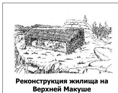
Реконструкция жилища на Верхней Макуше