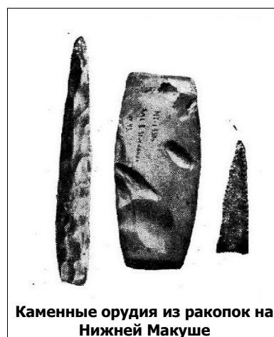
Каменные орудия из раскопок на Нижней Макуше

Жители древнейшего поселения на Макуше пользовались орудиями из кости и камня (смотри рисунок «Каменные орудия из раскопок на Нижней Макуше»). Для изготовления этих орудий употребляли зеленокаменную породу Урала, залежи которой известны в окрестностях Екатеринбурга. Из нее делали крупные