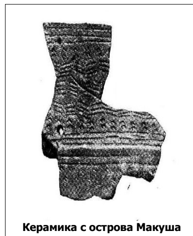
Керамика с острова Макуша