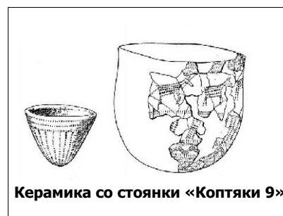
Керамика со стоянки «Коптяки 9»