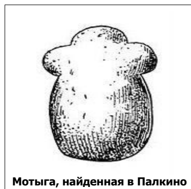
Мотыга, найденная в Палкино

Таким образом, на горе Маленькой были найдены два патриархально-родовых жилища, жители которых вели отдельное хозяйство и владели техникой обработки меди и железа. Находки таких вещей, как две медные блюхи, гарпуны, стрелы и рыболовный крючок, указывают на занятия коневодством, а также охотой и рыболовством,