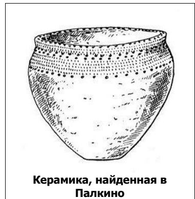
Керамика, найденная в Палкино

По остаткам материальной культуры определяется время существования селища — это эпоха раннего