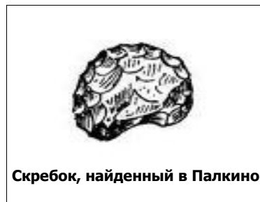
Скребок, найденный в Палкино