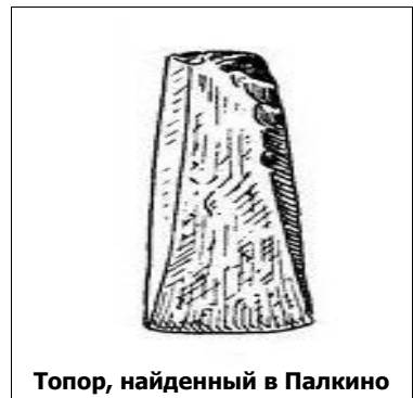
Топор, найденный в Палкино