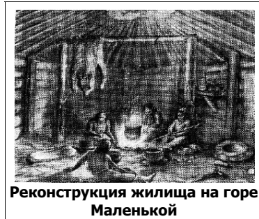
Реконструкция жилища на горе Маленькой