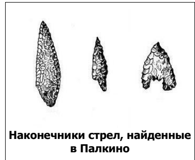
Наконечники стрел, найденные в Палкино