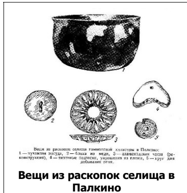
Вещи из раскопок селища в Палкино