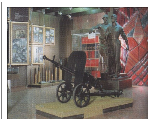
Военно-исторический музей Приволжско-Уральского военного округа

Особый интерес у посетителей музея вызывает новый раздел экспозиции — фрагмент рабочего кабинета командующего войсками УрВО (1948-1953 годы), маршала Советского Союза Г.К. Жукова.