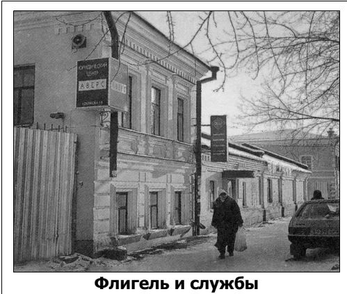
Флигель и службы

Флигель двухэтажный, каменный, расположен по улице Хохрякова. Основной прямоугольный в плане объем здания тянется в глубину участка, таким образом, главным фасадом служит торцовый. К флигелю со стороны южного фасада примыкает одноэтажное здание бывшей службы, которое длинным главным фасадом выходит на красную линию улицы Хохрякова.