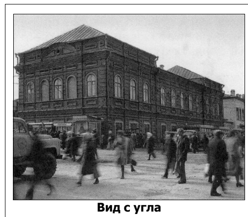
Вид с угла

Свод памятников истории и культуры Свердловской области. Том 1. Екатеринбург: Сократ, 2007; ISBN — 978-5-88664-313-3.