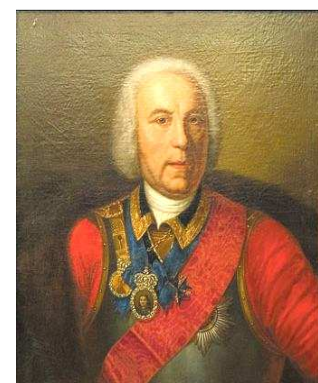
Г.В. де Геннин

Георг Вильгельм де Геннин - российский военный инженер, с 1727 года генерал-лейтенант, друг и соратник Петра Великого, специалист в области горного дела и металлургического производства.