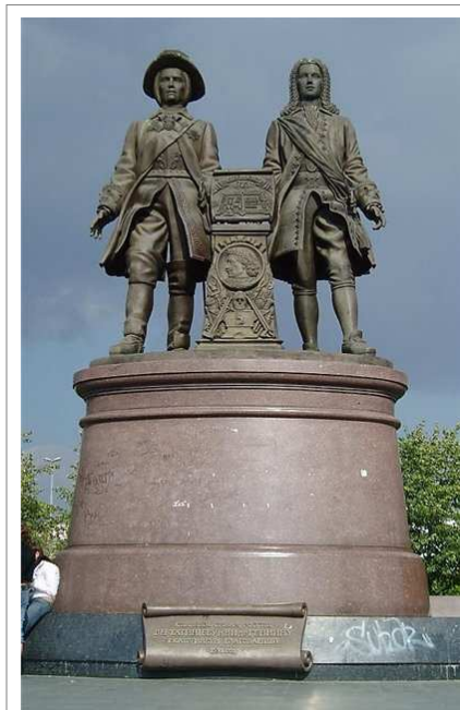
Памятник В.Н Татищеву и Г.В. де Геннину в Екатеринбурге

После окончания войны, в 1712 году Геннин был назначен командовать достройкой пороховых заводов и пушечного литейного двора в строящемся Петербурге, и был окончательно оценен Петром I как талантливый управляющий, что предопределило его дальнейшее назначение.