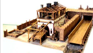
Макет доменной фабрики по описанию де Геннина

ГЕНЕРАЛО ЛЕЙТНАНТО ОАГІАЕРІ І КАВАЛЕРО ОРДЕНА СВЯТАГО АЛЕКСАНДРА ГЕОРГІЕВИЧЕМОУ ДЕТЕННИНУ СОБРАННАЯ НАТУРАЛІИ І МІНЕРА ЛІИ КАМЕРЪ ВСИБІРСКІ ГОРНЫ І ЗАВОДКНХЪ ДІСТРИКТАХЪ ТАКЖЕ ЧЕРЕЗЪ СВО ОВНОВЬ СТРОЕНЫ І СТАРЫ І СПРАВЛЕННЫ ГОРНЫ І ЗАВОМ СТРОЕНІЯ І ПРОЧІ КУРІОНЫХЪ ВЕЩА АБРИСЫ