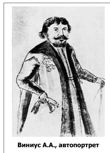
Виниус А.А., автопортрет

Андрей Андреевич Виниус родился в 1641 году в России (точное место его рождения неизвестно). С детства он получил хорошее образование (по свидетельству современников, он знал голландский, французский, немецкий, польский, латинский и древнегреческий языки, был сведущ в математике, горном деле, географии, алхимии и медицине). Будучи православным по крещению, он хорошо знал богословие, но в жизни придерживался и отдельных канонів кальвинизма (направление в протестантизме).