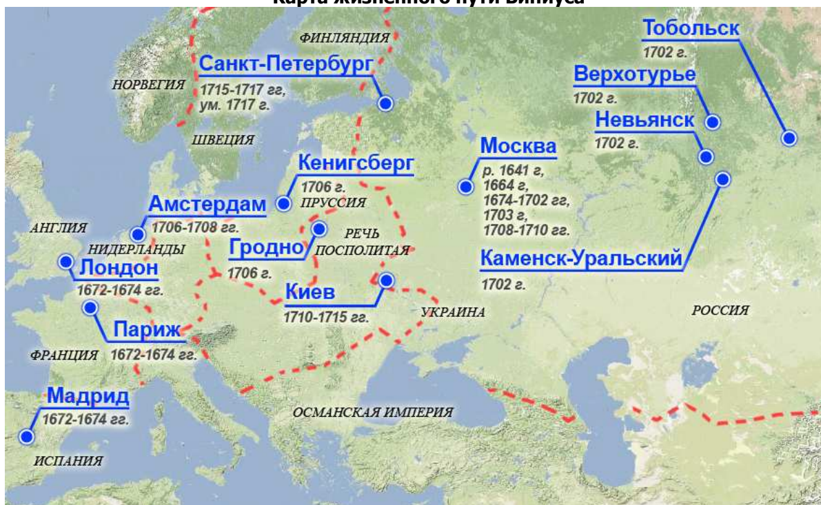
Карта жизненного пути Виниуса