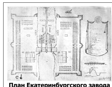
План Екатеринбургского завода

С 1724 года Клеопин являлся членом региональной горнозаводской администрации в Екатеринбурге. Кроме того, в 1745–1754 и 1756–1758 годах Клеопин исполнял обязанности главы горного ведомства на Урале.