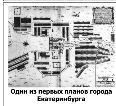
Один из первых планов города Екатеринбург