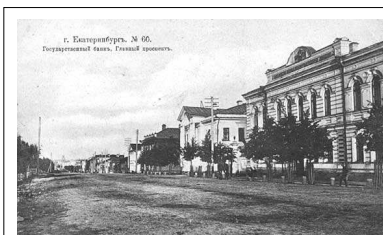
Отделение Государственного банка в Екатеринбурге, XIX век

В 1813 году Глинка был произведен в подполковники, а в 1818 году назначен командиром конно-