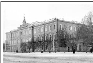
Уральское Горное училище 1850-е годы