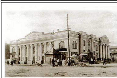
Здание первого в Екатеринбурге театра, начало XX века