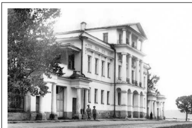
Дом Главного Начальника Уральских горных заводов, начало XX века