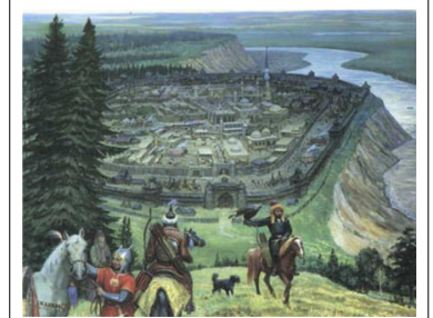
Визель А.Г. Искер - столица Хана Кучума на реке Иртыш