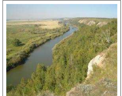
Кучумова гора (место ставки Кучума) на реке Ишим