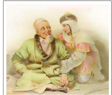
Знаменский М.С. Хан Кучум с любимой женой Сузге

В 1573 году племянник Кучума Маметкул и сын Алей, пользуясь трудностями Москвы, связанными с Ливонской войной, подошли к Перми и вторглись во владения Строгановых. И хотя экспедиция не трогала русских и разоряла только земли пермяков, это было крайне болезненно для Строгановых, т.к. пермяки являлись их податным населением, обязанным выплачивать им дань. Кроме того, появление Кучума на территории пермских владений вызывало восстание черемисов и попытку