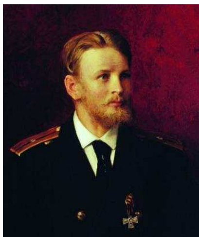
Строганов Сергей Александрович (1852—1923)