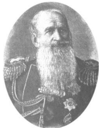
Строганов Александр Григорьевич (1795-1791)