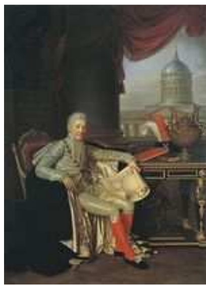
Строганов Александр Сергеевич (1733-1811)