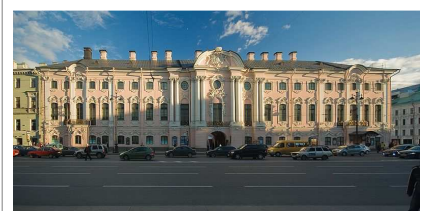
Строгановский дворец в Санкт-Петербурге (архитектор Растрелли)