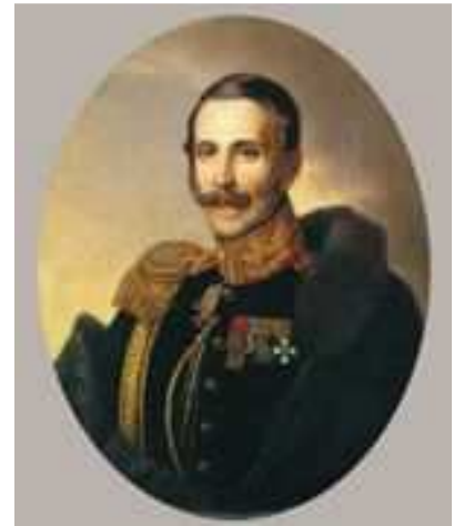
Строганов Сергей Григорьевич (1794-1882)

В 1608 году с началом польской интервенции Строгановы расстаются с позицией наблюдателей и начинают оказывать активную, сначала финансовую, а потом и военную помощь правительству Шуйского. В одной из жалованных грамот Петра Великого вычислено, что Строгановы во время междоусобицы и при Михаиле Феодоровиче пожертвовали правительству деньгами 841762 рублей. За эти услуги Строгановы были возведены в звание "именитых людей" и получили право именоваться с "вичем".