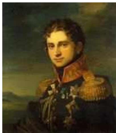
Строганов Павел Александрович (1774-1817)