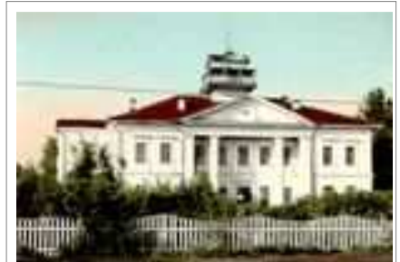
Школа в Очере, построенная Строгановыми