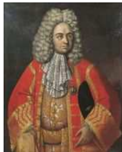
Строганов Григорий Дмитриевич (1656-1715)

В 1578 году братья произвели раздел всей унаследованной ими земли и имущества на три части: Семен Аникиевич, как старший член семьи, остался на обжитых строгановских землях в Сольвычегодске, Максиму и Никите достались Прикамские, Пермские и Зауральские территории.