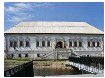
Палаты Строгановых в Усолье

В XVIII веке Строгановы в дополнение к соляным промыслам, пушнине и прочему, начинают заниматься металлургией. Занятия металлургией привели к столкновению Строгановых с Акинфием Демидовым, который к тому времени владел значительными территориями на Урале. Яблоком