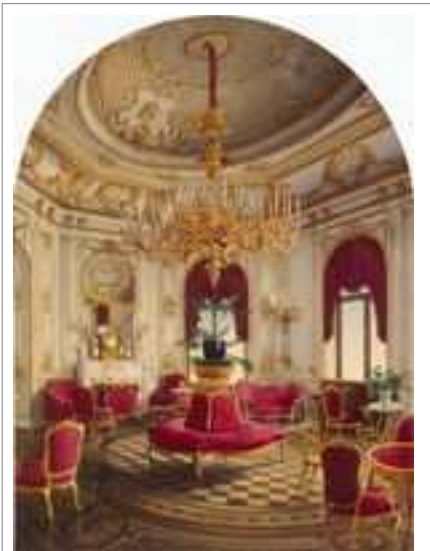
Дворец графа П.С. Строганова