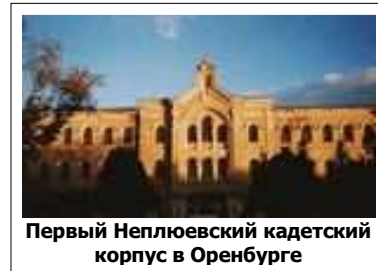
Первый Неплюевский кадетский корпус в Оренбурге