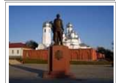
Памятник И.И. Неплюеву в Троишке