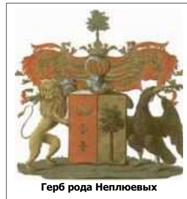
Герб рода Неплюевых

Неплюев налаживал хорошие отношения между народами населявшими край. Общась с Абул-Хаиром, а затем и его сыном он добился улучшения отношений со всем Казахстаном. Будучи главой края, Неплюев осуществлял твердую колониальную политику, хотя стремился действовать мирными средствами. О его благожелательности по отношению к мусульманскому населению края свидетельствует открытие в Оренбурге татарской школы.