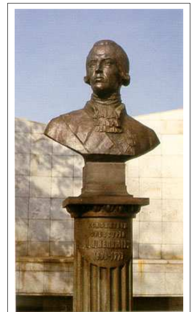
Памятник И.И. Неплюеву в Оренбурге

В 1725 году в Константинополь пришла весть о кончине Петра I. В 1727 году, с позволения Екатерины I, Неплюев перевез в Константинополь жену и дочь, а в 1730 году, при восшествии на престол Анны Иоанновны, получил чин контр-адмирала флота. В 1732 году, сильно заболев (по-видимому, лихорадкой), Неплюев отправил обратно в Россию жену, старшую дочь и двух младших детей, родившихся в Константинополе, а в 1735 году вернулся на родину сам. Здесь он был произведен в тайные советники и назначен присутствовать в Коллегии иностранных дел.