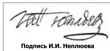
Подпись И.И. Неплюева