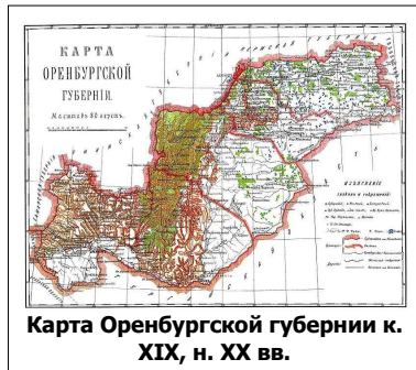
Карта Оренбургской губернии к. XIX, н. XX вв.